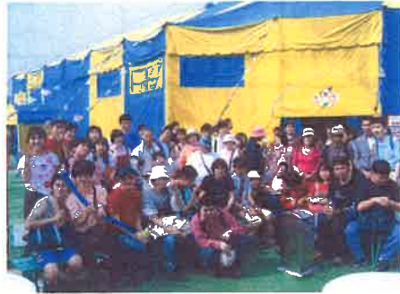
サーカス会場にて

お昼ごはんが終わるといよいよサーカス。かわいい子犬のショー・大きなぞうの芸・3台のバイクが走るバイクショー、そして空中ブランコ。皆さん夢中で観賞していました。「あれできる!!」「子犬かわいかったねー!」帰りのバスでも話が尽きない楽しい1日となりました。