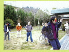
豆の勢いに鬼もタジタジ