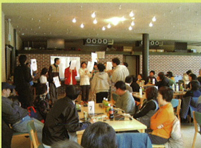
ゲームに思わず身を乗り出すお父さん