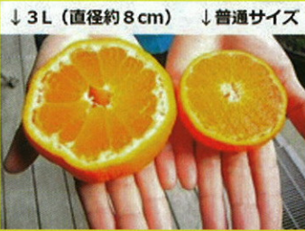
↓3L(直径約8cm) ↓普通サイズ

広島県を代表するみかん「大長みかん」を農家さんから直接仕入れて販売しています。大長みかんの魅力は、なんといってもその「甘み」にあります。瀬戸内の温暖な気候と山の傾斜地に石積みの段々畑が海からの反射を受け日照時間が長いことがみかんの甘みを増やしています。今販売しているのは、「温州(うんしゅう)みかん」という種類で2月下旬ごろまでの販売となります。3Lサイズ6個入りで200円にて販売しています。