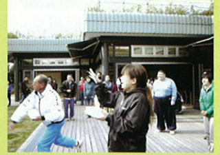
寅年メンバーが以外と少ない。目立つ!