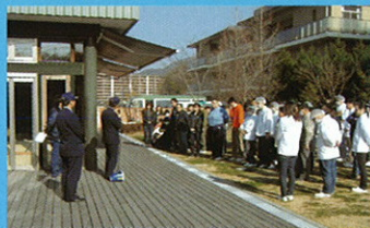
写真 班ごとに点呼をします

安芸消防署の立会いでの訓練でした。事前の予告がありませんでしたが、皆さん落ち着いて行動することができました。訓練を繰り返す事で非常時に体験を生かすことができます。これを機会に家庭でも避難路、防火器具、持ち出し物について確認してみるのも良いでしょう。