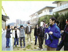
拡声器片手に奮闘職員