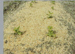
スナックエンドウ

「早く春来んかねー」といいながら、農作業を行っています。今月の作業は、ジャガイモの植え付け準備・スナックエンドウのネットはり・玉ねぎの追肥・除草作業です。作物に触れながら、作業をしていると気分がとてもスカッとなります。と、ある利用者が話しかけてこれ、自分も同じですよと答えました。何気ない会話ですが、自然のありがたさを強く感じる瞬間でした。