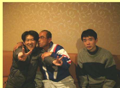
写真 楽しい時間をすごす皆さん