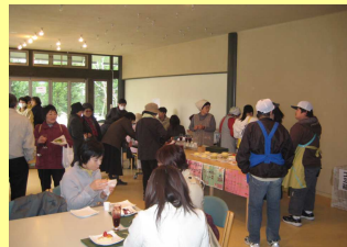
ケーキ販売はいつも行列ができます。

今回はブルーベリーの苗木の剪定講習や、草木染め体験に人気が集まりました。年々遠くからおいでになる人が増え、「森の工房AMAといえばブルーベリー」が定着し、またブルーベリーの苗木が各地へお嫁入りし、広がっている事を実感しました。