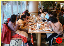
③リーガロイヤルホテルで食事