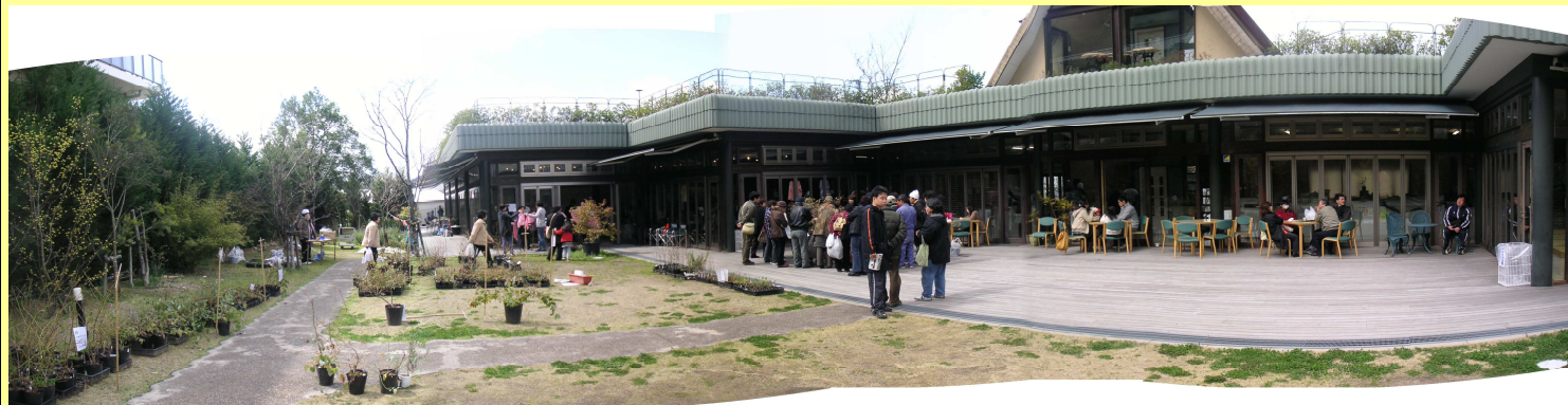
森の工房AMAのたたずまい(春のブルーベリーフェアの真ん中の人だかりはブルーベリーの剪定実習会) デッキのカフェも人気スポット