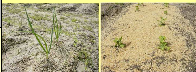
大きくなってきた玉ねぎ 種から発芽したエンドウ

暖かく感じる日も多くなり、春がやってきました。冬の間みんなで作った畝に、春まきの野菜の種や苗を植え始めました。収穫まで時間がかかりますが栽培する楽しみや喜びをみんなと共有しながら愛情を持って育てていきたいと思ひます。