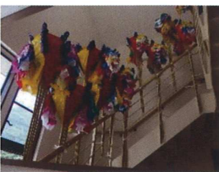
(らせん階段を彩る灯ろう)