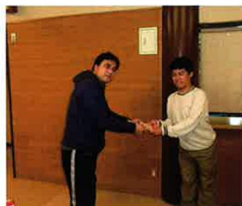
第2森の工房 AMA の様子