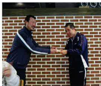
森の工房 AMA の様子