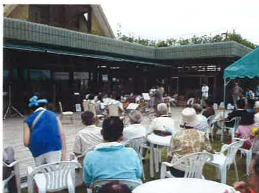
矢野中学校生徒による演奏