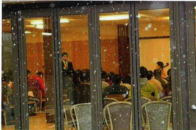
雪の舞う中での開催でした