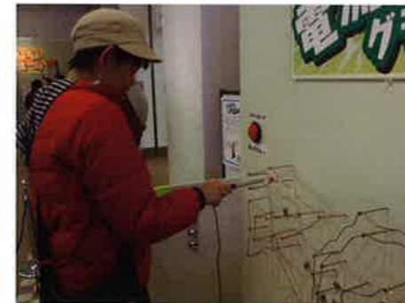
体験コーナーにて