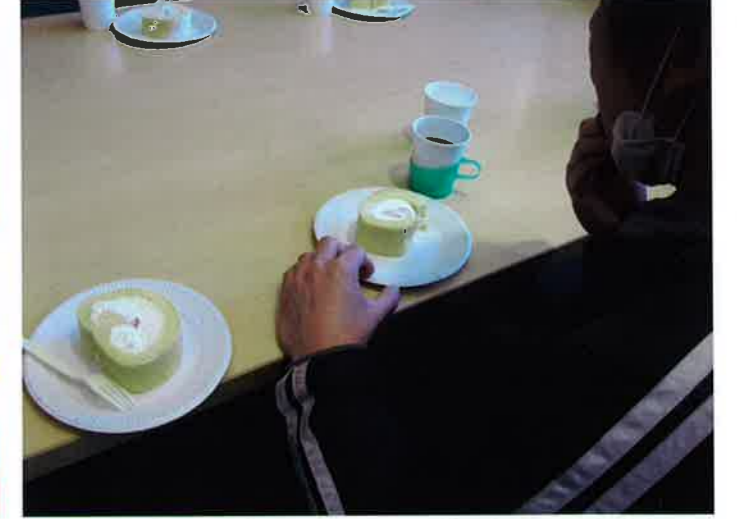
デザートはぶるーベリー班が作ったロールケーキ