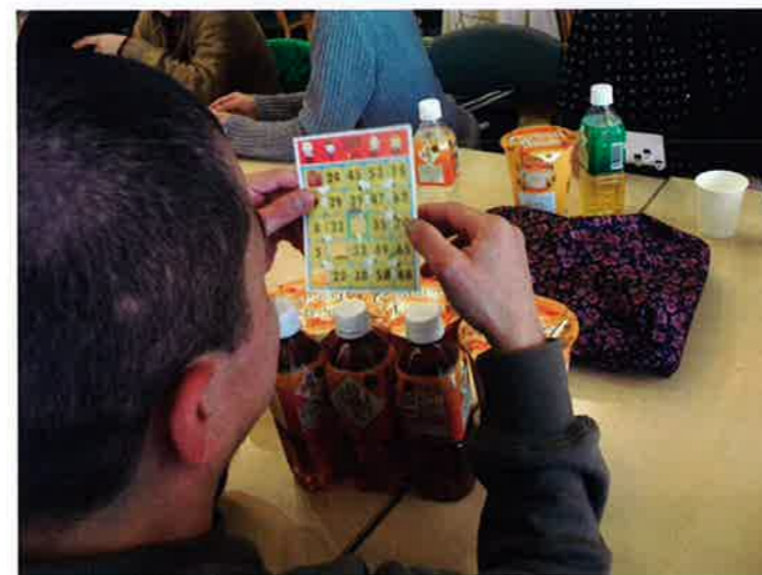
豪華な賞品目指してビンゴ狙うぞ!