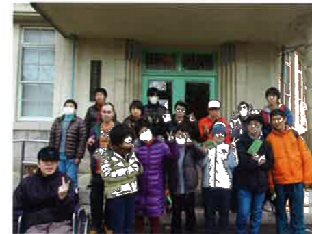
江波山気象館の前で集合写真

2月14日(金)に、江波山気象館へ行き、マリーナホップで昼食を食べました。かえで班で外出する機会は今までなかったので、みんなとても楽しんでいました。