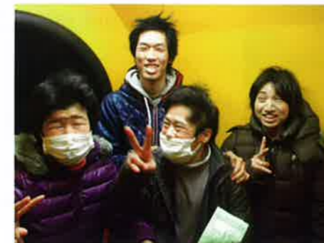
風速 20m の風を体験中!