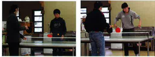
かえで班は、自由活動で卓球大会をしました。仲間同士で応援する姿も見られました。

生活介護のみなさんの自由活動 かえで(みみずく) オリーブ班、もくれん班(やの) 毎週火曜、木曜の午後に実施