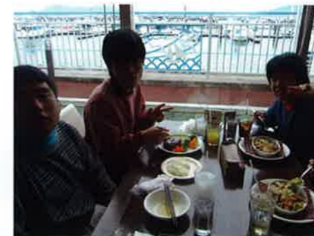
海が見えるレストランでランチタイム♪