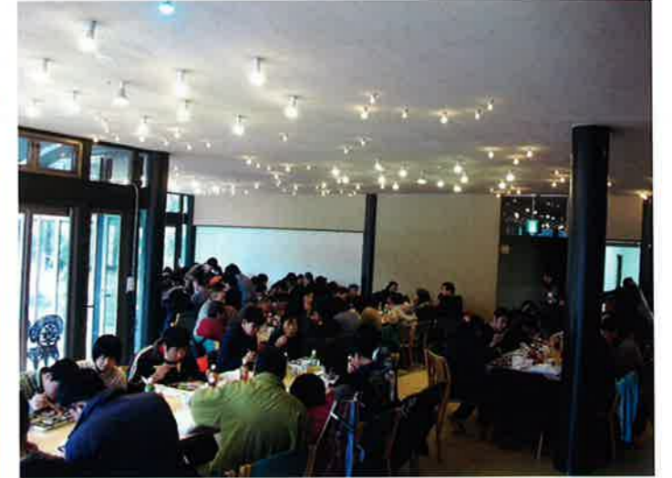
会話を楽しみながらのお弁当タイム