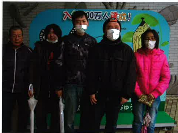
みんなで記念撮影☆

1月30日(木)に、植物公園に行き、イオンモール広島府中で昼食を食べました。久しぶりの外出に、日頃の気分転換になったのではないのでしょうか。