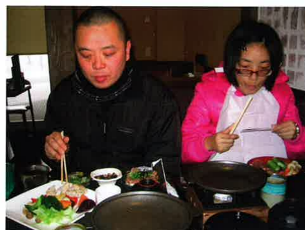
食べたい物をそれぞれ注文♪