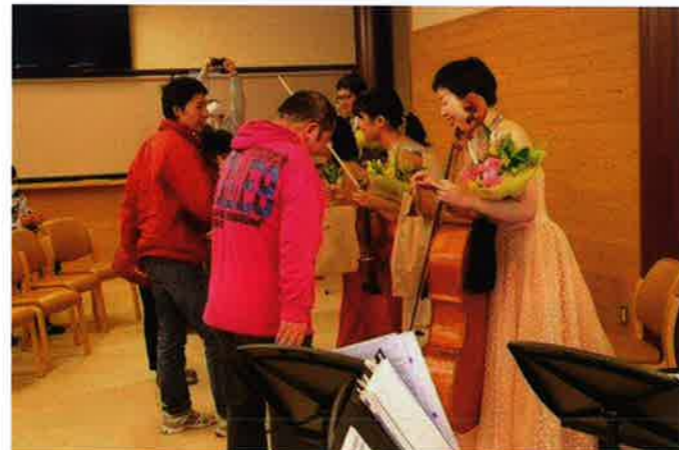
利用者から花束と AMA 製品のお土産を贈呈