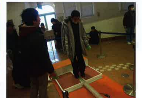
みんなで体験コーナー