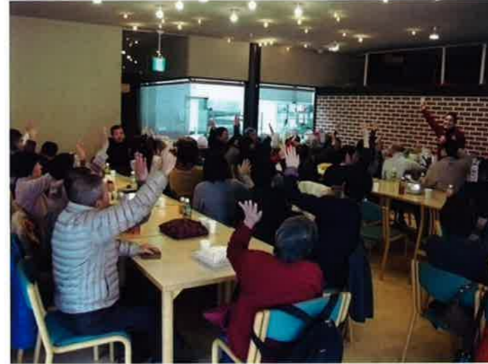
みんなで楽しくゲーム♪

1月25日(土)に、森の工房AMAで毎年恒例の家族会主催の親睦会がありました。今年はお弁当ごとに分かれて座り、おいしいお弁当やデザートを食べ、ゲームをして親睦を深めました。