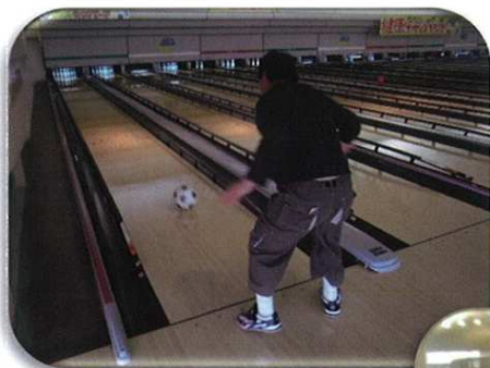
よ〜く、ねらいを定めて・・・