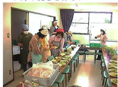
みんなで配膳をして……