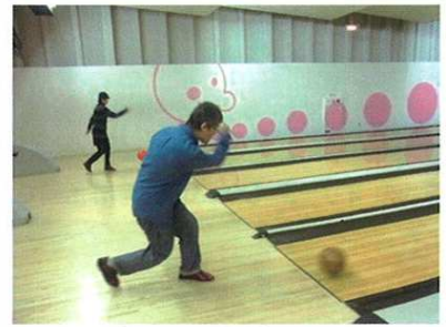
このボールの行方は・・・???