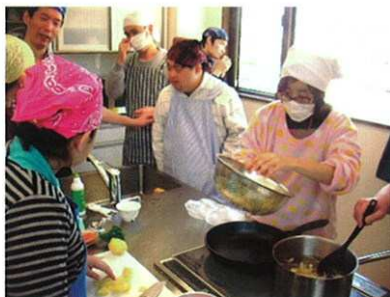
スープを作るチームに分かれました