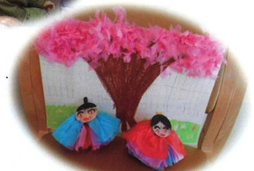
やの生活介護 創作活動の作品