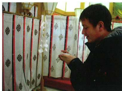
日本のお正月 初体験デス