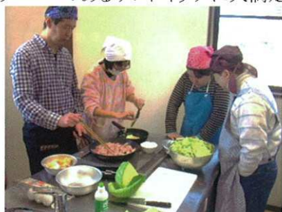
お好み焼きを作るチーム

2月22日(土)森の工房やの多目的室・会議室で料理教室がひらかれました。今回は、お好み焼き風サンドイッチ・サラダ・スープを17名参加者で力をあわせて作り、果物・ジュースを添えました。みなさん真剣に作った後はさわやかな笑顔。ボリュームのあるサンドイッチに大満足でした。