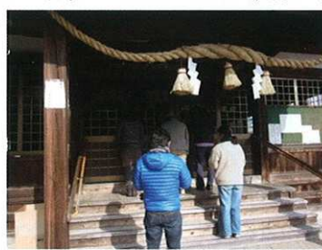
今年1年、良い年になりますように