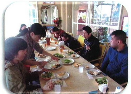
運動の後の昼食はとてもおいしかったよ