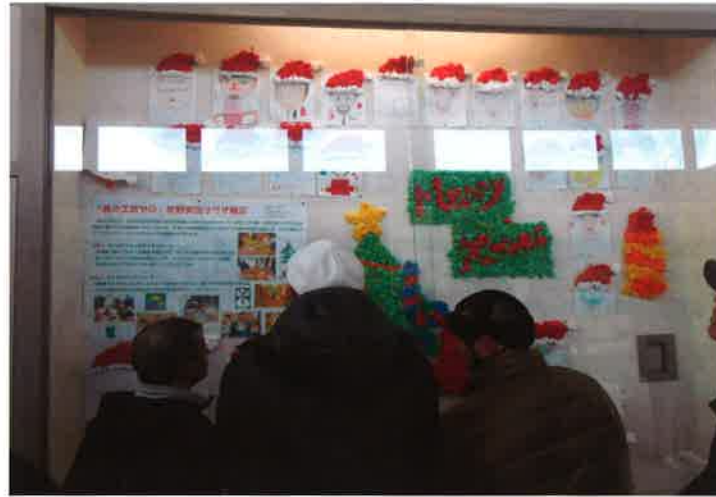
自分の作品はどれかな? 自画像のサンタを探します