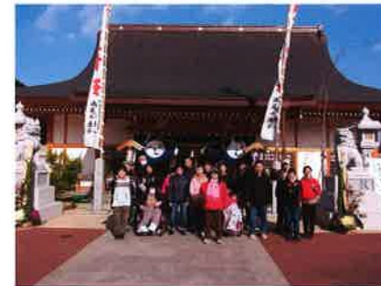
仁保姫神社に行ってきました 生活介護やの・かえで班一同

安芸の郷は1月7日が仕事始め。それぞれの予定に合わせて各班ごとに初詣に行ってきました。今年も1年良い年でありますように！