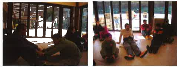
寒い日は室内で体を動かす活動をするこも