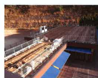
1階の畑づくり完了