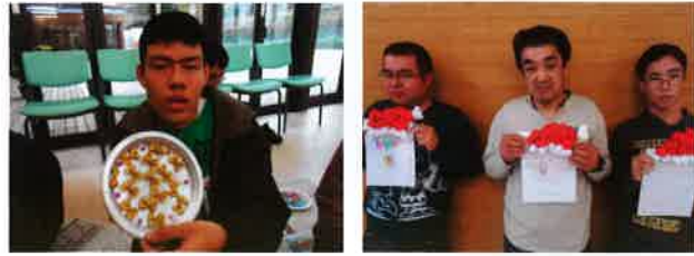
12月の創作活動はクリスマスにちなんだ物を作りました