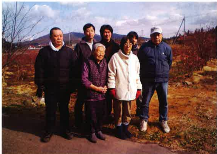
寒い中ですが頑張ってきました

ブルーベリー農園のある豊栄に研修行ってきました。ブルーベリーの木の様子を見ながら来年の為に肥料やすくも撒いてきました。来年も豊作でありますように!