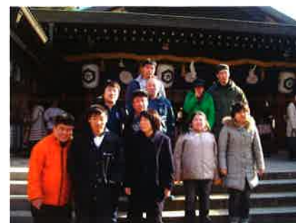
岩滝神社前 就労継続Bみみずく・ブルーベリー班一同