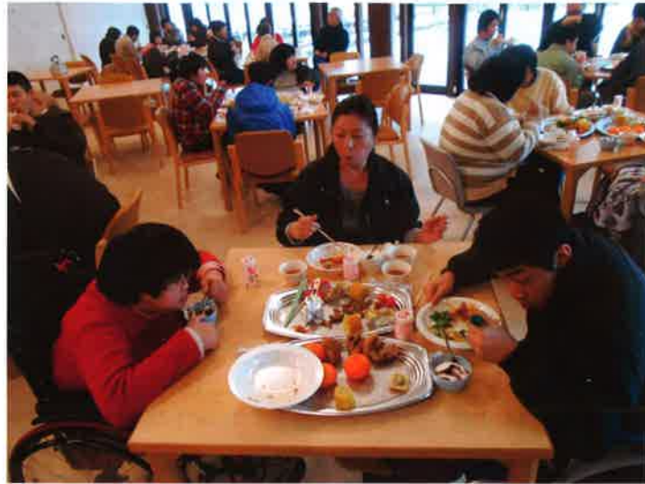
おいしいご飯に会話も弾みます

12月21日(金)の給食はクリスマスランチでした。チキンやいろいろな種類の食事をみんなで楽しみました