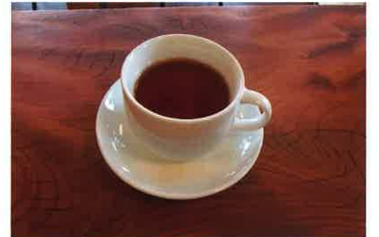
ケーキにぴったり紅茶