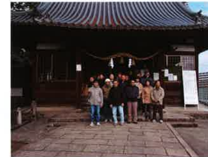
尾崎神社に行ってきました 就労継続Bあやめ・さくら合同です