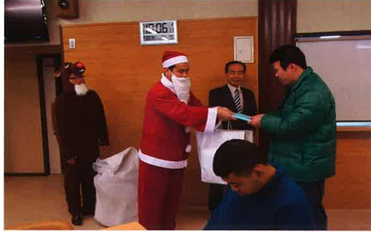
第2AMAにて。自治会会長が代表でプレゼントを受け取りました

12月20日(木)マツダ労働組合の組合員の皆さまからクリスマスプレゼントを頂きました。サンタクロースとトナカイの来所にみんな大喜び。プレゼントを手にとっても素敵な笑顔を見せてくれました