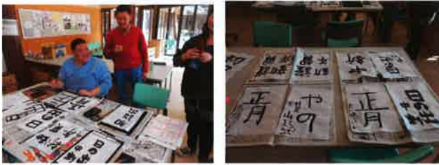
1月と言えばやっぱり書き初め！力作が並びます