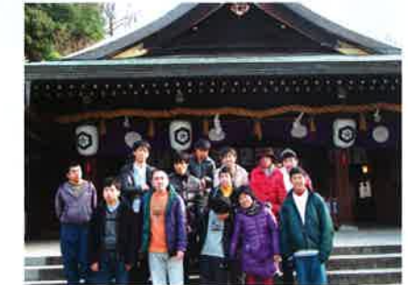
岩滝神社前 就労継続Bみみずく・ひいらぎ班、生活介護みみずく・かえで班