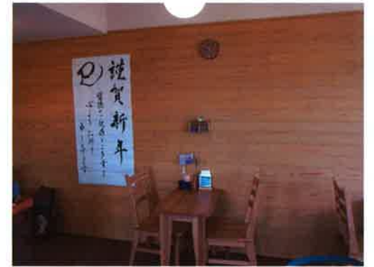
今年も営業が始まりました

cafeさくらが開店し早5ヶ月。新メニューとしてカフェラテと紅茶を始めました。お近くをお通りの際はぜひお立ち寄りください。