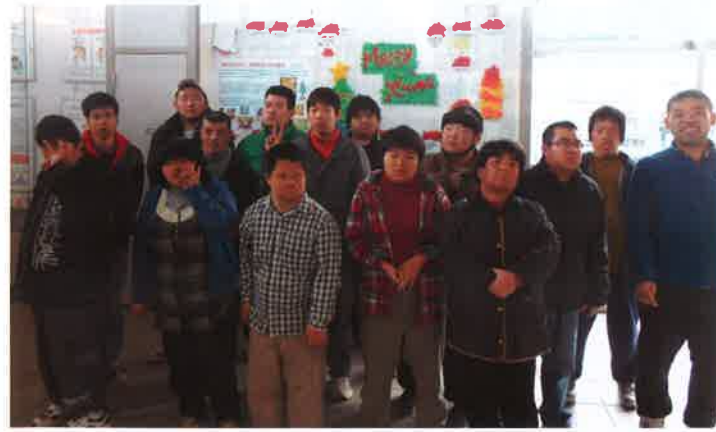
作品の前ではいポーズ!