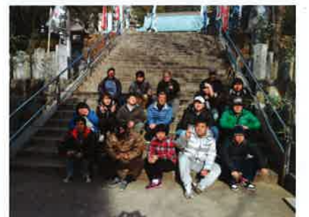
ちょっと休憩中 生活介護やの・もくれん班