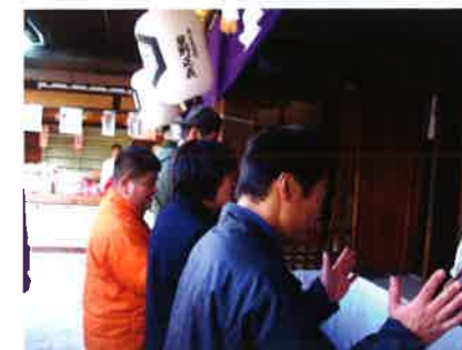
今年一年良い年でありますように！