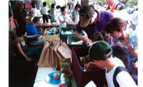
アンケートに答えて抽選で景品をゲット