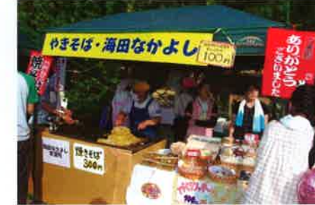
海田町の海田なかよし作業所も出店