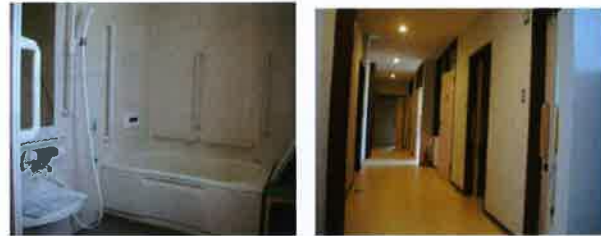
浴室の様子 リビング側から見た様子