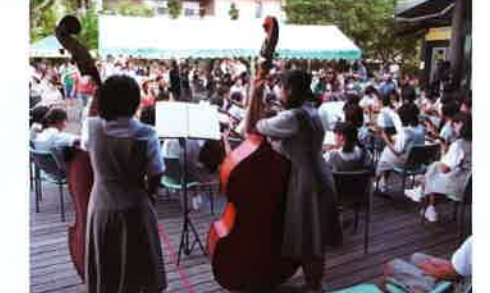
矢野中のギター・マンドリン部のステージ演奏