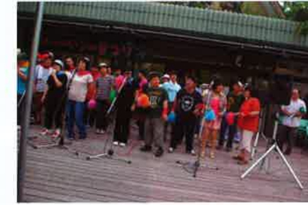
利用者のブルーベリーコーラス隊によるステージ発表