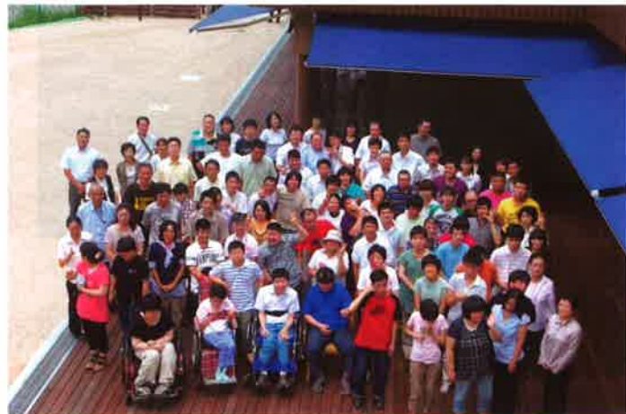
8月1日開所式終了後の記念集合写真