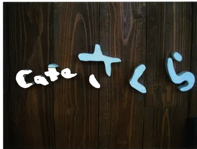
カフェさくら入口サイン

第2AMAでは、就労継続B型の利用者・職員を中心にカフェさくらの準備に追われています。 カフェでは、本格的な機器を導入して、コーヒー等の飲み物とソフトクリームやケーキ等のスイーツの販売を予定しております。 オープンに向けて準備しておりますのであと少しお待ちください。