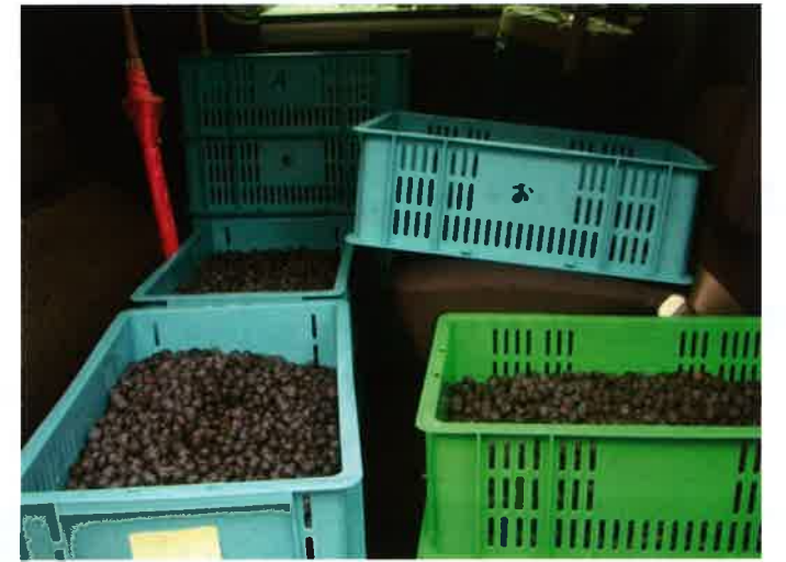
一日分の収穫量です