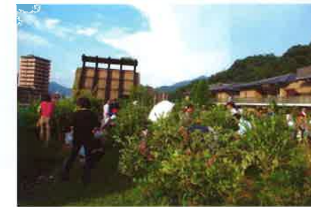
ブルーベリーは品名も表示され、食べ比べが人気