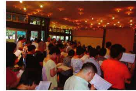
式典での利用者の合唱。「あなたにしかできないこと」