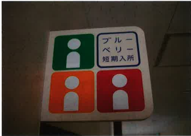
短期入所「ブルーベリー」は第2AMA 2階フロアにあります

第2森の工房AMAでは、新たに短期入所事業「ブルーベリー」定員3名を開始しました。 短期入所は原則、15:00～翌9:00間での時間を利用して、利用者と職員が協力して食事を作り余暇活動等を通して自立した生活が送れるようサポートいたします。 事業内容・費用等お気軽にお問い合わせください。