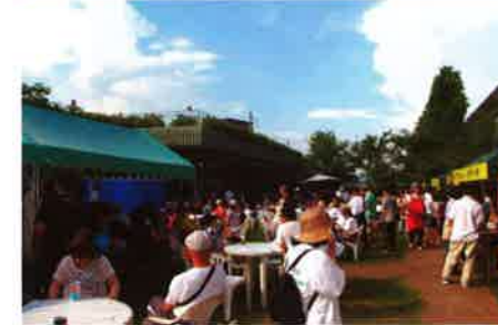
庭でつろぐみなさん