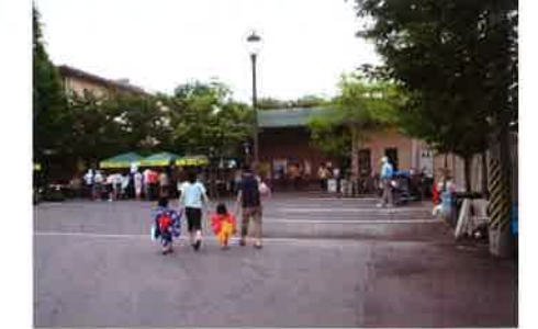
夕方、浴衣姿でまつりにお見えの家族連れ

第9回森の工房 AMA ブルーベリーまつりは7月28日(土)に開催されて約1100名の参加で無事終わりました。今年も楽しんで頂き、森の工房 AMA と地域の皆さんとの交流、ふれあいができました。みなさんありがとうございます。