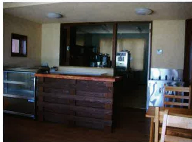
お客さま側からの店内の様子