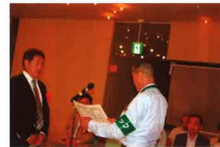
毎年検診頂く安芸歯科医師会に感謝状贈呈