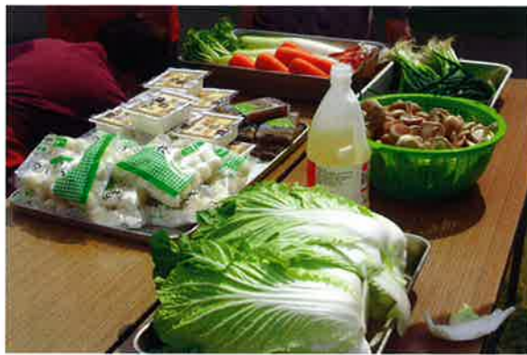
材料はそろいました。焼き芋も焼けているかな？