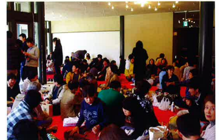
大盛り上がりの会場。