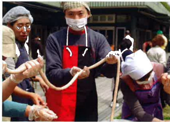
羊の腸にスパイスを効かしたミンチを注入します。