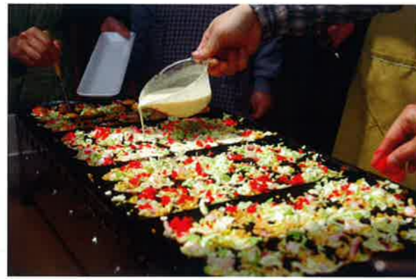
年々、上手く作れるようになったたこ焼き。