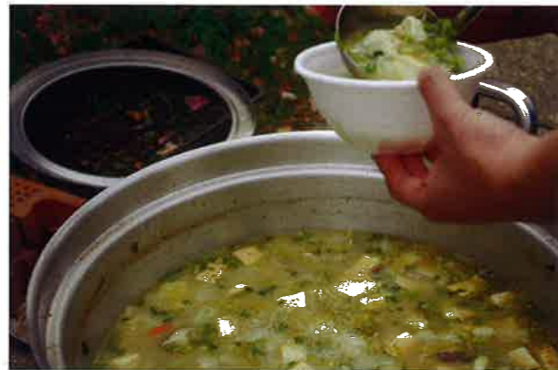
大量の豚汁。熱々をいただきました

当初3月23日に計画されていた、デイキャンプでしたが、数日前から荒天が予想され、急遽、1週間ずらし、30日に開催となりました。おかげで春の日差しが暖かく上着がいらぬほどでした。(献立 焼きいも、豚汁、たこ焼き、手づくりウインナー)ウインナーは後日給食であやめ天然酵母パンにはさんでいただきました。