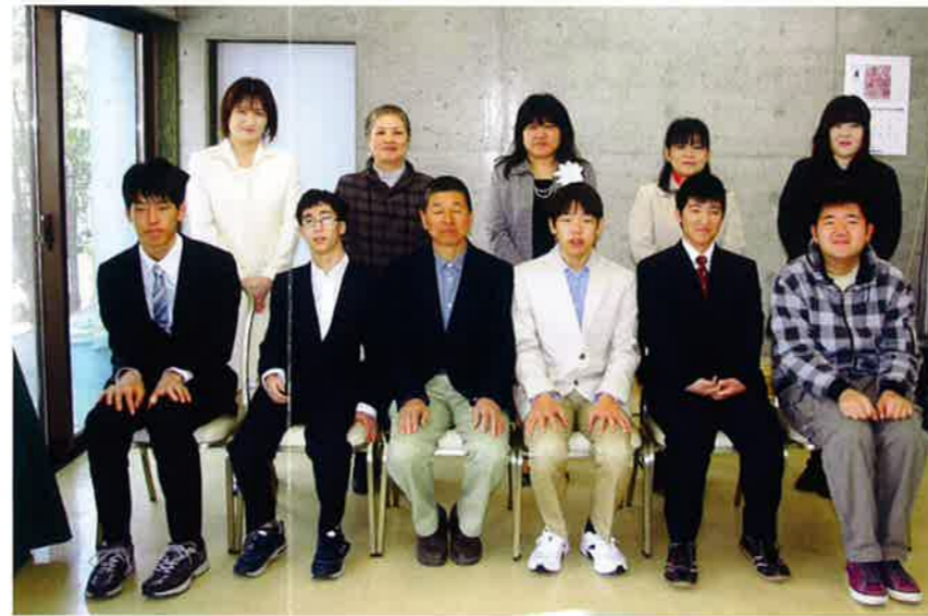
入所式後に記念撮影 皆さんハイチーズ！

特別支援学校高等部を卒業したばかりのニューフェイスが森の工房AMAの一員になりました。今年は広島市特別支援学校から3名、県立呉特別支援学校から2名の元気な男子ばかりです。4月2日の入所式では緊張の面持ちでしたが、その後着替えて各作業班に移動し、歓迎をうけました。