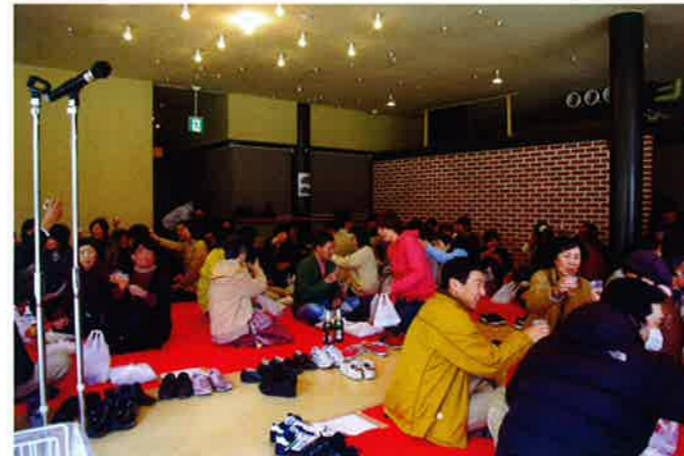
親も子も職員もボランティアもクジで席がまきまします。