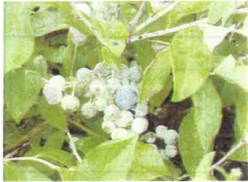
収穫直前のブルーベリー

屋上果樹園のブルーベリーは三種類ありますが、早いものはおいしそうなお実を付けて収穫できます。 現在は、食品班が主となって収穫していますが、全利用者が一度に収穫ができるのもあと少しです。 生食・ジャム・パンやクッキーの材料になるので楽しみに待っていて下さい。