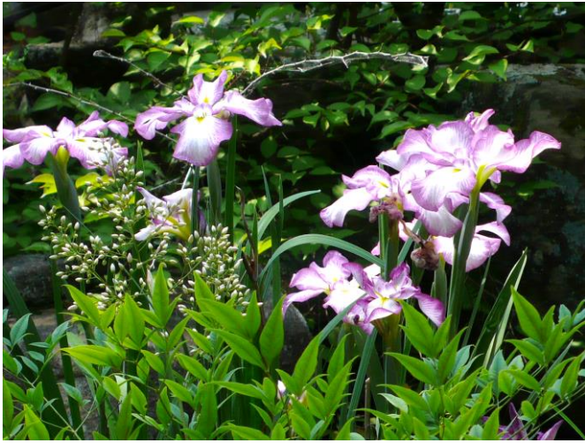
6月22日(土)。庭には池もある。ブロックを置いた上にプランターごと沈めてる花菖蒲が開花(家の廊下からみえるアングルで)