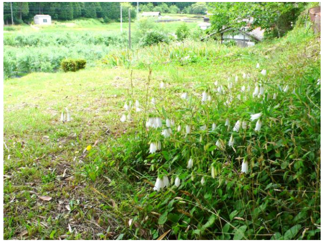
6月29日(土)。里山のふもとに咲くのは草刈りから除外されたホタルブクロの小さい群落。