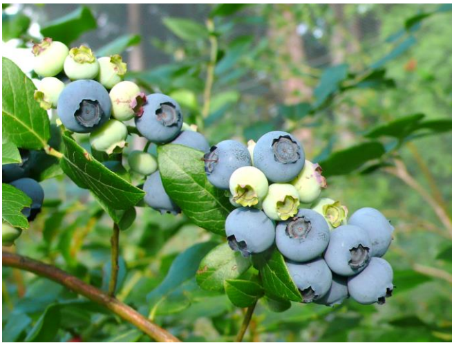
6月23日(日)。早生(北部ハイブッシュ系)のスパルタン。一番大きい実がおいしく、小さいのはまだ酸味が強い。