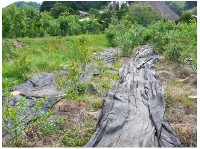
6月23日(日)。畑のブルーベリーの列間に防草シートを敷く作業がつづく。