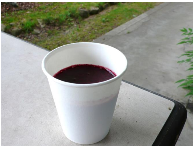
6月23日(日)。摘み取ったブルーベリーで今シーズン最初のジュースを作る。

*お知らせ 安芸の郷のブルーベリーまつりが7月27日(土)午後4時から8時まで開催されます。天然酵母パンやブルーベリージャムやジュースの販売は4時半から。駐車場はあります。利用者有志によるステージ発表もあり、地域の皆さんとお会いできる賑わいあるまつりです。今年で16回目となります。昨年が豪雨災害で中止になったので2年ぶりの開催となります。