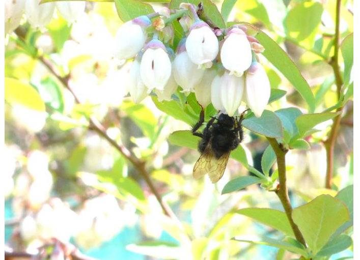
5月3日（金） 蜜蜂が忙しく受粉を進めてくれている。