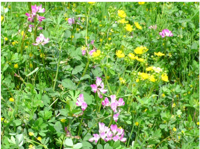
5月2日（木） レンゲもちらほら畑に咲く。