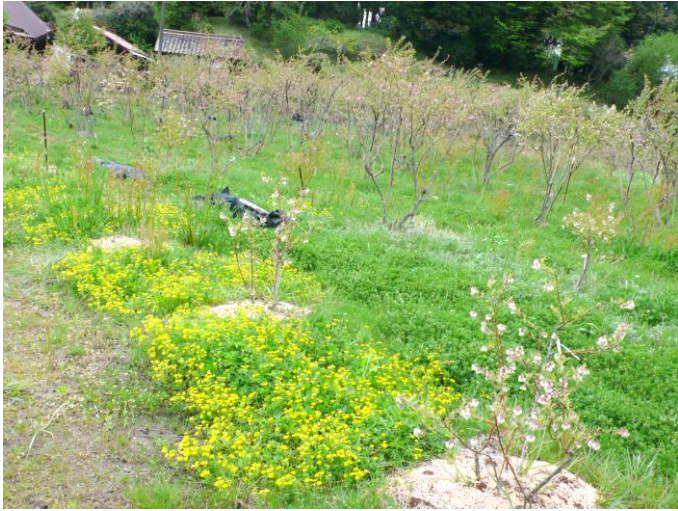
5月2日（木） 背の低いキジノムシロが畑に広がる。

も4月と違った花が咲き訪れる蜜蜂や蝶々や鳥が楽しげにやってくる。その農園の4月末からの剪定作業を続けながらの10連休からの様子。