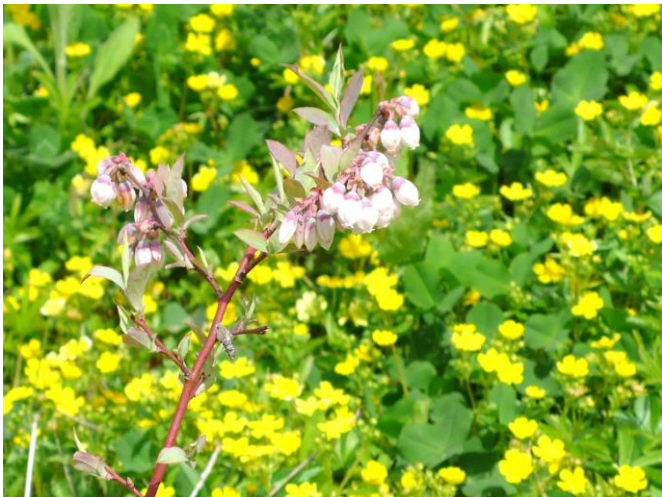
5月2日（木） ブルーベリーの花はまだ満開とはいかないが花が開き、葉が伸びてくる。