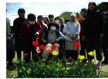
昨秋、第2森の工房AMAの庭に植えた、チューリップがきれいな花を咲かせてくれました。 ←森の工房やのくるみ班集合写真