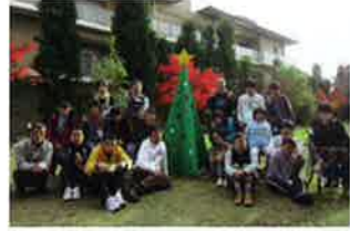
森の工房みみずく(生介)作品

森の工房みみずく生介、森の工房やの生介は創作活動で、それぞれクリスマスコンサートで展示するクリスマスツリーをつくりました。