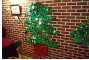
森の工房やの(生介)作品