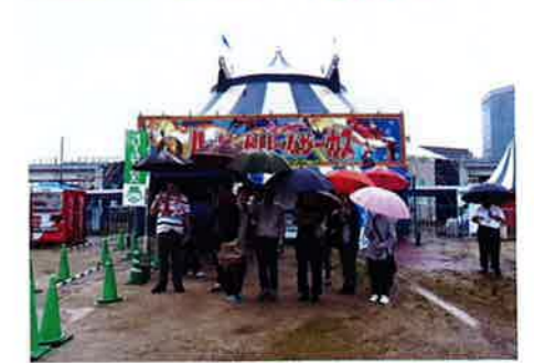
6月5日(金) 森の工房あやめ 森の工房やの就B(さくら)