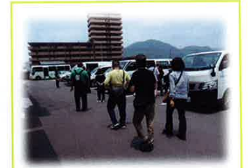
昼食をいつもより、1時間はやくすませ、会場に向かいました。