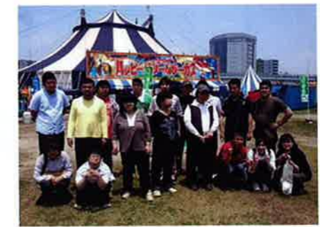
6月12日(金) 森の工房やの生介 (もくれん班)