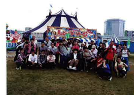
6月9日(火) 森の工房やの生介 (オリーブ班・くるみ班)