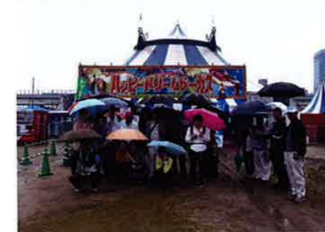
6月5日(金) 森の工房みみずく就B(あき)