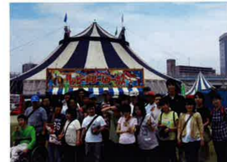
6月2日(火) 森の工房みみずく生介