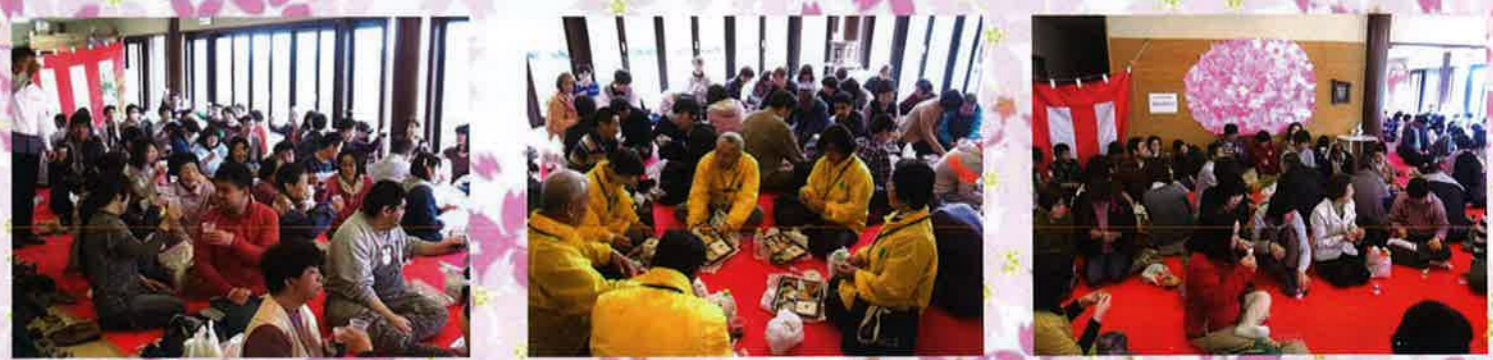
安芸の郷の利用者、家族、職員、ボランティア総勢181名の参加がありました。

4月4日に第2森の工房AMAの食堂でお花見を開催しました。今年も天候の影響により屋内での開催となりましたが、お弁当やデザートを食べながら歓談し、自己紹介やゲームで大いに盛り上がりました。お花見は今年で13回目。安芸の郷の関係者があつまり、親睦をはかる大切な行事となっています。