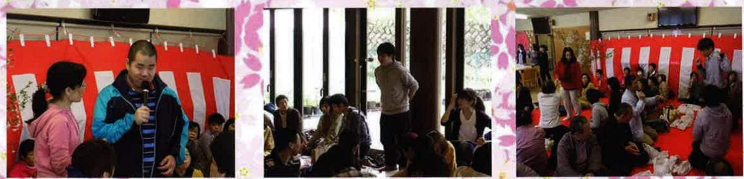
自己紹介、ゲームの様子。ゲームは万歩計を振り、1分間で何カウントできるか班対抗できそいました。