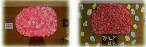
やの生介作成 みみずく生介作成

4月4日に行われたお花見。屋内での開催でしたが生活介護の利用者が自由活動で作成した桜が行事を華やかにいろどってくれました。