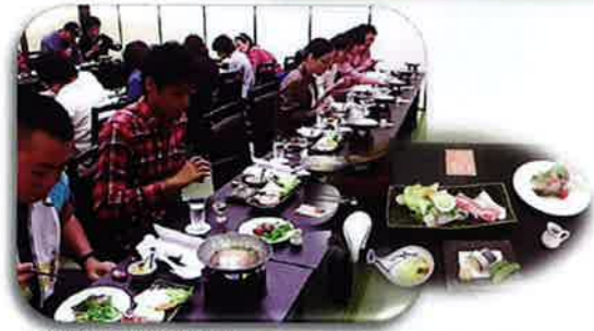
色とりどりの料理：みなさんモクモクと食べています