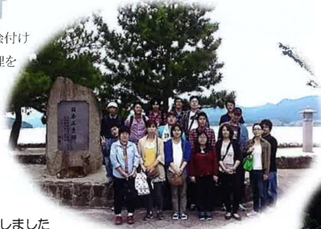
集合写真：はい！笑って笑って・・・