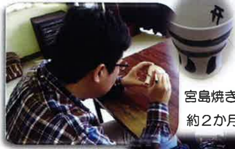
宮島焼に思い思いの絵付けをしました 約2か月後の完成が楽しみッ！！

9月19日(金)、研修旅行で宮島へ行ってきました。宮島焼の絵付け体験をしたあと、宮島へ渡り記念撮影！宮島錦水館で日本料理を満喫しました。その後、入浴組・散策組に分かれて思い思いに行動し、お土産を買って帰りました。