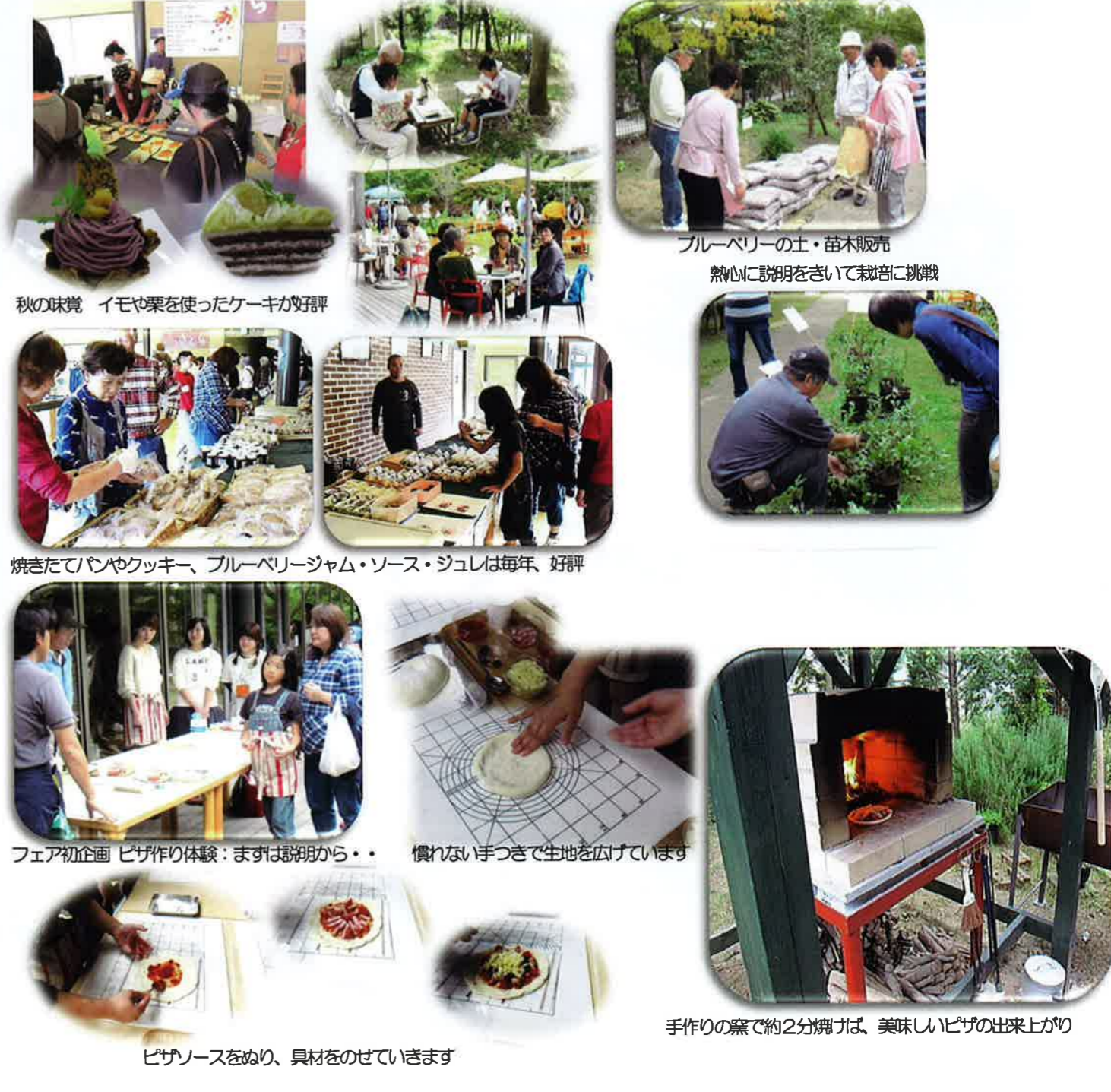
秋の味覚 イモや栗を使ったケーキが好評

10月11日(土)きれいな秋晴れの空の下、秋のブルーベリーフェアが開催されました。フェア初登場の「ピザ作り体験」では、ピザ生地成形に挑戦苦闘しながらも子どもから大人まで楽しんで頂きました。お手伝いいただいたボランティアの方々、出勤された利用者のみなさん、お疲れ様でした。