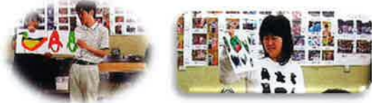
自由活動で描いた絵をみんなの前で発表しあいました(かえで班)

生活介護のみなさんの自由活動 かえで班(みみずく) もくれん班、オリーブ班(やの) 毎週火曜、木曜の午後に実施