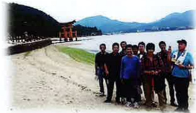
宮島の鳥居をバックに記念撮影