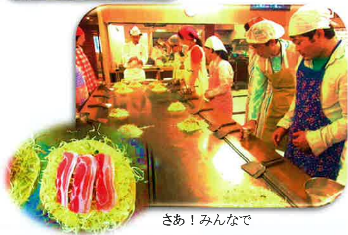
さあ！みんなで Let's お好み焼き作り