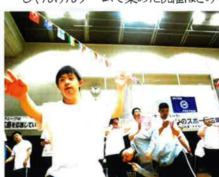
のりのりで「世界に1つだけの花」を合唱中