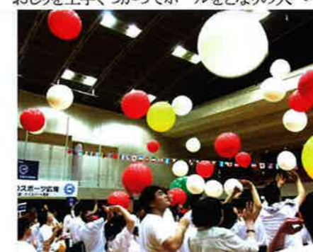
相手陣地にボールを投げ入れろ!!