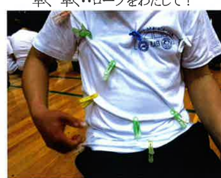
じゃんけんゲームで集めた洗濯ばさみ