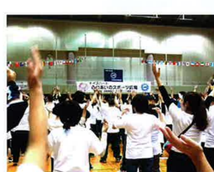
準備体操をして、準備オッケー!!