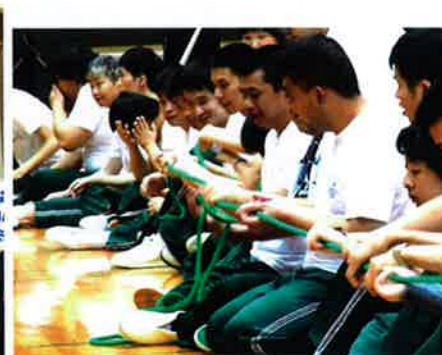
早く 早く..ロープをわたして!