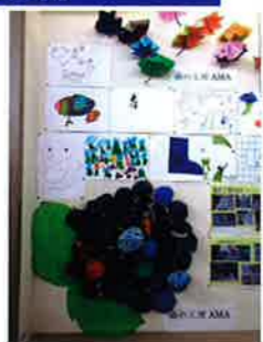
「6月」をテーマに作りました やの交流プラザに展示中です