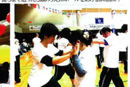
二人一組になって、ユニバーサル体操