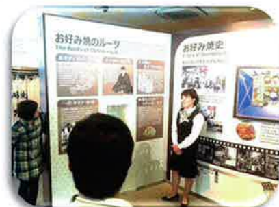
まずは、お好み焼きの歴史から学びました。

5月26日(月)森の工房あやめ・さくら合同自治会主催行事でオタフクソースの見学に行ってきました。あいにくの雨でしたが、工場のライン見学や歴史を学ぶなど、とても有意義な時間を過ごしました。昼食は、お好み焼き作りをご指導いただきながら自分で作りました。初めての方も多かったのですが大満足でとても楽しい1日となりました。