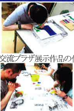
やの交流プラザ展示作品の作成中

生活介護のみなさんの自由活動 かえで班(みみずく) もくれん班、オリーブ班(やの) 毎週火曜、木曜の午後に実施