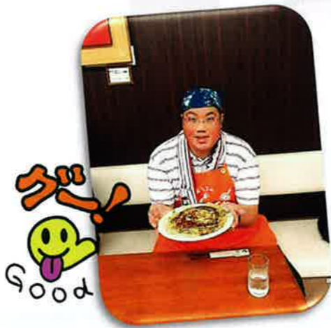
おいしそうでしょ！！