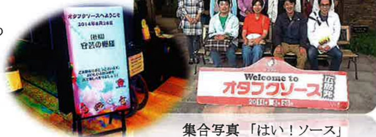
集合写真「はい！ソース」